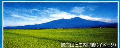
鷲海山と庄内平野(イメージ)