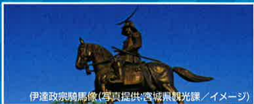
伊達政宗騎馬像(写真提供:宮城県観光課/イメージ)

※Go To キャンペーン適用には条件がございます。必ずお申し込みの前に参加条件をご確認ください。予約締結後であってもキャンペーン対象とならない方がいらっしゃった場合は旅行契約を解除いたします。