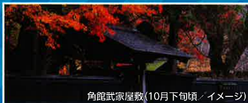
角館武家屋敷(10月下旬頃/イメージ)