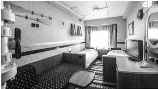
客室の一例(ANNEX クルージングキャビン3)