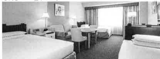
客室の一例(デラックスファミリー)