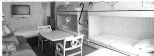
客室の一例(グランデ6)