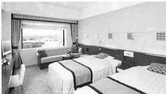
客室の一例(プレジャールーム)