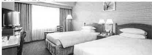
客室の一例(スタンダード)